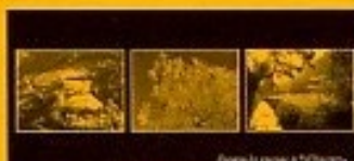
n°3 - originale en couleur