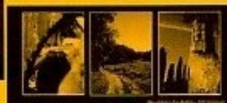
n°6 - originale en noir et blanc