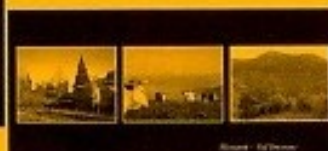
n°2 - originale en couleur