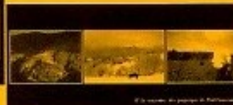
n°4 - originale en couleur