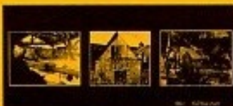
n°1 - originale en noir et blanc

Une première série vient d'être éditée. Les photographies ont été prises en majorité par Anne-Sophie Gomes qui s'est occupée de ce projet. Au total, une centaine de vues a été sélectionnée. Un premier tri a permis d'en garder une cinquantaine. Les élus ont procédé à une ultime sélection en conseil communautaire afin d'éditer six cartes comprenant trois vues différentes chacune. Elles seront prochainement en vente dans les mairies, les commerces et les offices de tourisme.