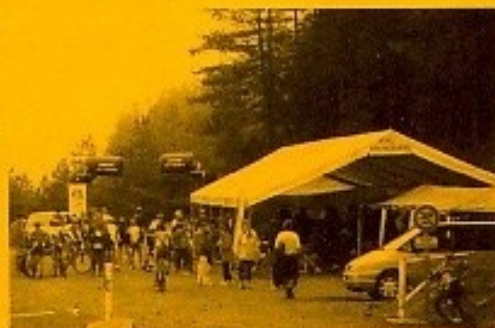
Le chapiteau de Val'Couserans utilisé lors du Trophée Vtt d'Erp au Col d'Ayens.