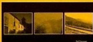
n°5 - originale en couleur