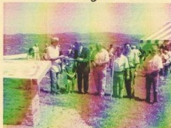
L'inauguration a réuni tous les intervenants qui ont contribué à la réalisation de ces tables d'interprétation.

Sachez que des fiches randonnées sur les trois tables sont disponibles au siège social de la Communauté de Communes et dans les offices de tourisme de Saint-Girons et Saint-Lizier.