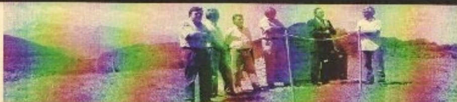
Inauguration des tables d'interprétation