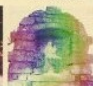
Oratoire dédié à la vierge