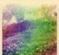
Jardin et Château