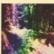
VTT au Col d'Ayous