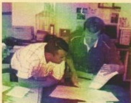
Etude des plans existants pour aménager le local.

Pour Lescure, la bibliothèque se situera à côté de l'école. Pour ces derniers sites, les travaux sont prévus l'année