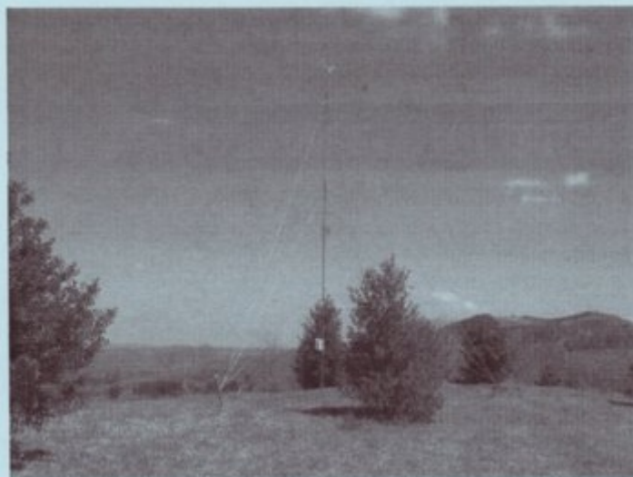
Le mât de mesure de 10 mètres installé depuis un an sur la crête de la Croix à Rivèrenert.

Si la société estime les résultats de cet automne et de cet hiver intéressants, elle pourrait envisager d'implanter un nouveau mât de mesure de 40 à 60 mètres pour obtenir des données plus précises et confirmer les mesures.