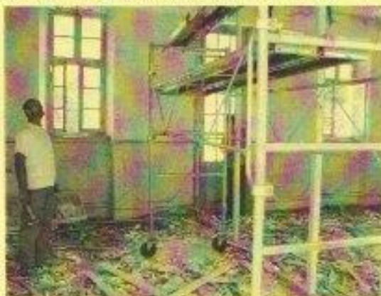
Les travaux de démolition à Rivèrenert et Alos

> A Alos , les locaux prévus à côté de la mairie, une fois débarrassés ont