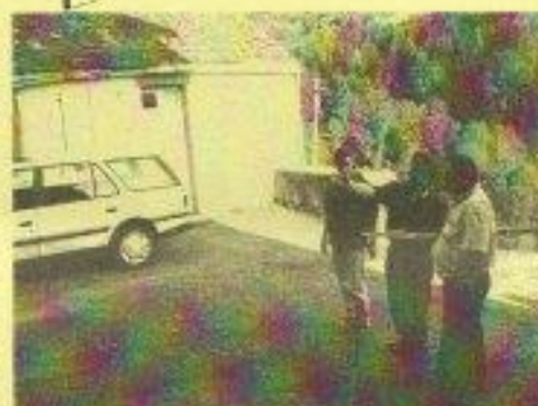
Jean-Claude DEGA, le maire d'ERP, montre l'emplacement de la future bibliothèque à l'architecte.

> Pour Clermont , il s'agit d'une construction nouvelle qui sera édifée sur le terrain face à la mairie. Le permis de construire a été déposé. L'appel d'offre lancé. Les travaux devraient commencer en début d'année.