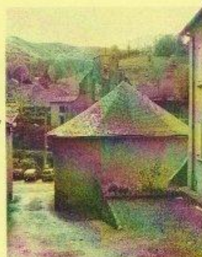
Chapelle Saint-Roch vue de derrière.

Mail : tpsr@libertysurf.fr ou tpsrfree@free.fr ou tpsrorange@orange.fr