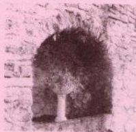
Vase sur socle