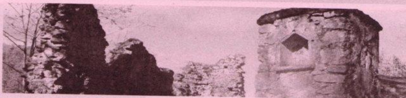
Ruines du Château-Fort de Clermont