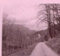
Route du Cap d'Erp