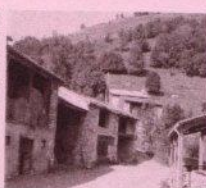
Fermes au Lauch