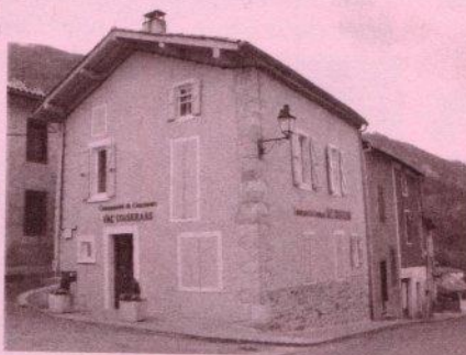
Le bâtiment avant et après travaux.