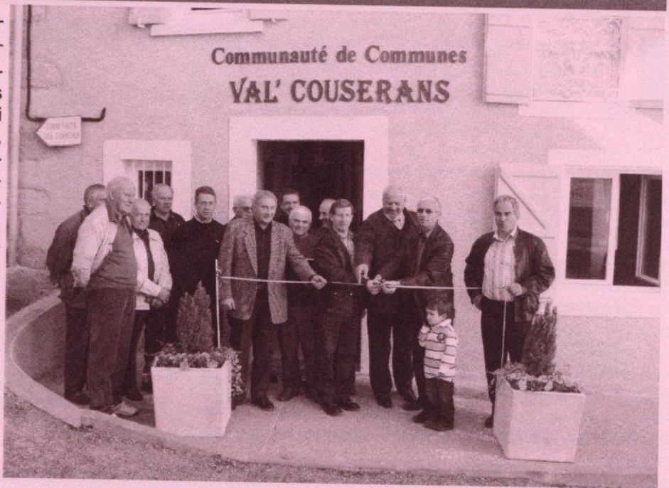
Couper de ruban avec les délégués de la Communauté de Communes.

La communauté de communes VAL'COUSERANS existe depuis dix ans. Au début son siège se trouvait à l'étage de la salle polyvalente de Rivèrenert, jusqu'à ce que l'intercommunalité achète en 2000 une vieille bâtisse à restaurer au centre du village. La Communauté a donc aménagé l'intérieur par le SIVOM de Saint-Lizier, dans un premier temps, en créant des bureaux fonctionnels, une petite salle de réunion, des archives, une cuisine et une grande salle de conseil communautaire au rez-de-chaussée. Dans un second temps, deux studios ont été aménagés au second étage par l'agent intercommunal, afin de pouvoir accueillir des stagiaires. Enfin, il ne restait plus qu'à s'occuper de l'extérieur, en refaisant les façades et en apposant deux enseignes en métal réalisées par Michel JOUANIN, artisan de Rivèrenert.